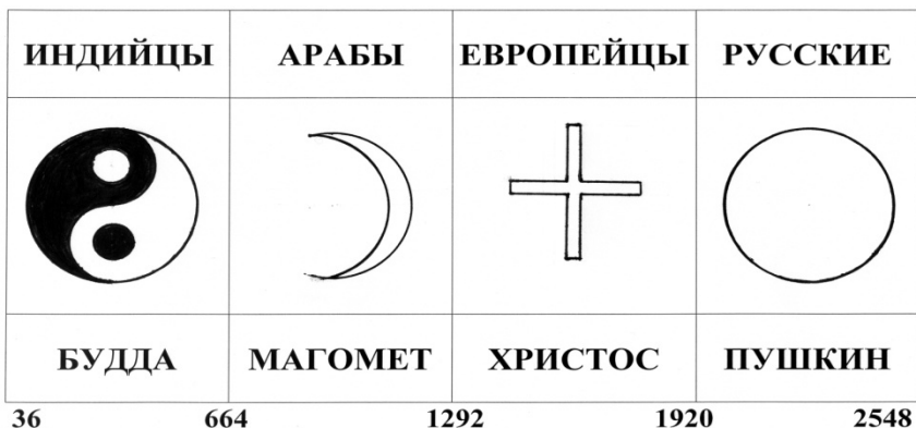
Рис. 1. Лидирующие цивилизации 8-ой эры и их пророки.

На Земле имеются точки, которым требуется энергоподпитка, и есть точки, в которых концентрируются излишки энергии. В тех местах, где происходят войны, наблюдается нехватка энергии. Земля берёт от людей то, что ей не хватает, поэтому она втягивает в себя энергию от людей. При избытке энергии планета распространяет её на самих людей. У человека ответная реакция и на недостаток энергии, и на избыток одна – активизация действий. Следует понимать, что Земля – это всего лишь этап в развитии человека. Она - далеко не лучшее, что может иметь душа для своего развития. Тем не менее, человеку всегда необходимо относиться с должным уважением и почитанием к тому миру, в котором он живёт.