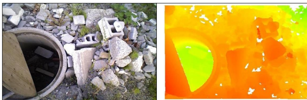
Рис. 7. Фотометрическое изображение камеры ASUS Xtion RGB-D для визуализации

В последнее время стали доступны компактные видеокамеры, к которым можно отнести камеру Asus Xtion RGB-D. Такие устройства способны вычислять глубину завалов, используя изображения, генерируемые фотометрическими камерами. Щебень, образовавшийся в результате структурного обрушения, не обладает достаточной уникальной текстурой, чтобы обеспечить точную оценку глубины. При этом, глубина кодируется как разница между левой и правой камерой и извлекается путем идентификации набора точек соответствия между двумя изображениями [19].