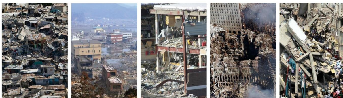
Рис. 2. Чрезвычайные ситуации, вызвавшие обрушение зданий

Использование 3D-моделирования для построения дескрипторов интересующего объекта является одним из перспективных векторов идентификации пострадавших при проведении аварийно-спасательных работ. Основным преимуществом моделирования является их инвариантность к свойствам материала, точке зрения и освещенности по сравнению с методами, основанными на внешнем виде. Кроме того, эти подходы упрощают задачу сегментации рисунка-фона по сравнению с подходами, основанными на внешнем виде. Возрождение интереса к визуализации местности произошло благодаря внедрению недорогих RGB-D камер и доступности к считыванию трехмерных моделей (рис. 5).