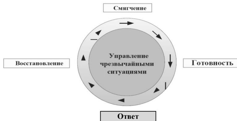
Рис. 1. Цикл управления ЧС

ЧС способствуют обрушению зданий и сооружений. В городских условиях структурное обрушение зданий может привести к тому, что люди оказываются в ловушке образовавшихся обломков. Во время спасательных операций выжившим оказывается помощь, а поиск жертв, находящихся под обвалами зданий продолжается [8-9]. Поведение аварийно-спасательных работ требуют дополнительных усилий, так как некоторый строительный материал (например, бетон) может вызывать вторичные обрушения. Проблема поиска людей под обвалами разрушенных зданий является актуальной задачей аварийно-спасательных отрядов, участвующих в ликвидации последствий ЧС [10].