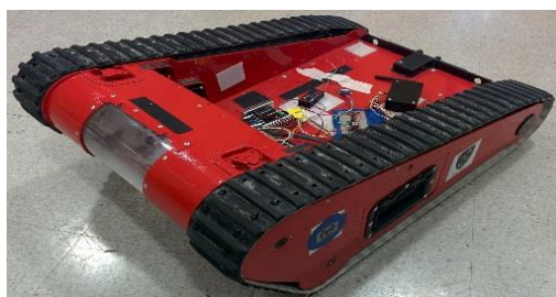
Рис. 3. Наземный робот Matilda