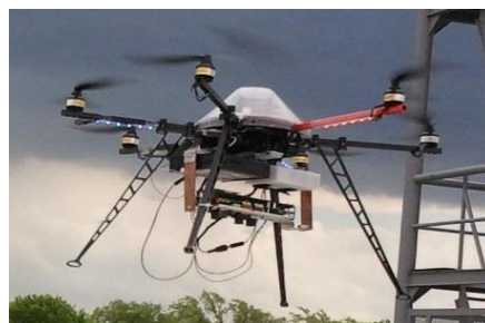
Рис. 4. Беспилотные летательные аппараты