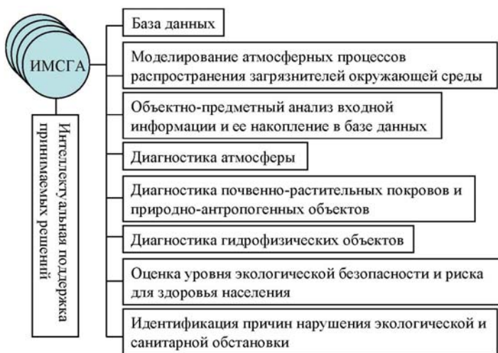
Рис. 1. Функциональная структура ИМСГА

среды на заданной территории. Существующий опыт создания и использования подобных систем подсказывает иерархическую структуру базы данных, построенную по принципу последовательной дискретизации территории. Изложенные выше принципы такой дискретизации могут быть обобщены в виде схемы рис. 1. Следуя этой схеме можно без ущерба структуре системы постоянно увеличивать детальность дискретизации, сохраняя предметную ориентацию пикселей \Omega_{ij} и т.д. Таким путем структура и функции системы настраиваются на естественную композицию данных о различных аспектах функционирования природных, антропогенных и природно-антропогенных ландшафтов. Система лишь синтезирует имеющиеся данные и подсказывает, какие еще необходимо получить. Заложенные в структуру системы алгоритмы и модели обеспечивают интеграцию данных по пространству и предметным областям, за счет чего формируется целостный образ территории с происходящими на ней процессами.